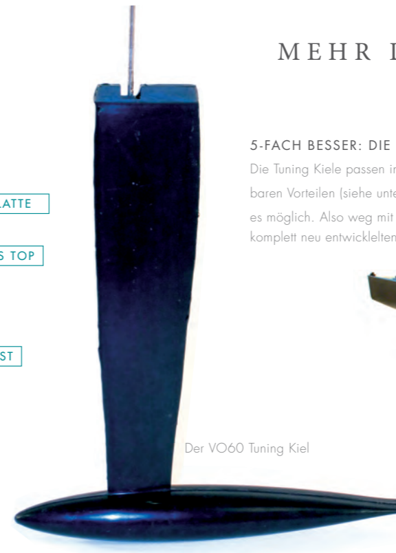
Der VO60 Tuning Kiel

Die Tuning Kiele passen in die Aufnahmen des AC60 oder VO60/ACC110. Neben den unbestreitbaren Vorteilen (siehe unten) sehen die Kiele auch noch besser aus – CNC-gefräste Formen machen es möglich. Also weg mit dem plumpen Serienbremsklotz, her mit dem High-Tech-Flügel! Mit diesem komplett neu entwickelten Kielen verbessern Sie die Segeleigenschaften Ihres Bootes radikal.