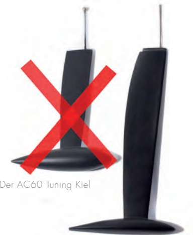
Der AC60 Tuning Kiel