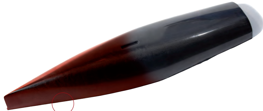
EINE KLASSE, 2 BUGDESIGNS

Der Rumpf ist sehr leicht, stellt aber immer noch einen Kompromiss zwischen Gewicht und Resistenz gegenüber Transportbeschädigungen dar. Auf Wunsch können wir Rumpf, Deck und Ruder noch leichter bauen, das Boot wird dadurch allerdings empfindlicher gegenüber Beschädigungen durch Punktbelastungen.